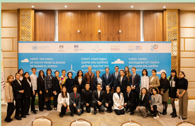
Дебатқа қатысушылардың топтық суреті

«Халықаралық қатынастар» мамандығы бойынша КАЗГЮУ студенттері төрт топқа бөлінді: «Жеңілдету», «Адаптация», «Қаржы» және «Ынтымақтастық». Іс-шара жастардың жетістіктері мен қиындықтарын көрсетуге мүмкіндік берді және климаттың өзгеруіне қарсы тұрудың жаңа идеяларын талқылау үшін негізгі мүдделі тараптармен өзара әрекеттесуге мүмкіндік берді.