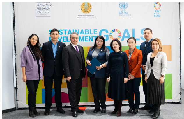
Семинарға қатысушылардың топтық суреті

15 қарашада М.Нәрікбаев атындағы КАЗГЮУ университетінде «Тұрақты дамуды қамтамасыз ету Қазақстан Республикасы Президентінің Қазақстан халқына Жолдауын іске асырудың басты миссиясы ретінде» семинары және «Миссия-2030» іскерлік ойыны өтті.