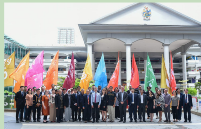
SDSN делегаттарының топтық суреті

2022 жылдың 17 және 18 қарашасында БҰҰ Тұрақты даму шешімдерінің желісі (SDSN) Санвей университетінде орналасқан Азиядағы ең жаңа хатшылық кеңсесін іске қосты. Sunway City Куала-Лумпурдағы кеңсе Париж (Еуропа мен Африканы қадағалайтын) және Нью-Йоркпен (Американы қадағалайтын) үш жаһандық орталықтың бірі болып табылатын SDSN Азиядағы бас кеңсесі ретінде қызмет етеді.