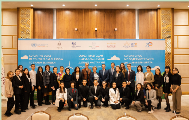
Фото участников дебата

Участниками выступили студенты Университета КАЗГЮУ по специальности Международные отношения и были разделены на 4 группы: «Mitigation», «Adaptation», «Finance» и «Collaboration».