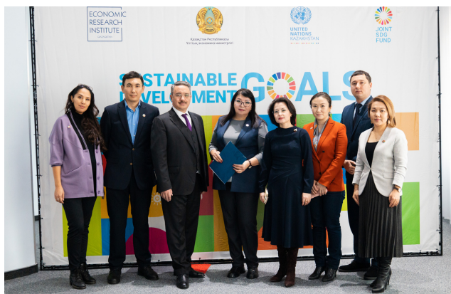
Фото участников семинара

15 ноября в Университете КАЗГЮУ им. М.С. Нарикбаева прошел семинар на тему «Обеспечение устойчивости развития как основная миссия реализации Послания Президента РК народу Казахстана» и Деловая игра «Миссия 2030».