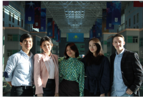
SDSN Youth Kazakhstan құрамасы

2023 жылғы 18 қаңтарда SDSN Youth Kazakhstan командасы Anchor Schools және Дүниежүзілік банктің бірлескен күшімен ұйымдастырылған әрі қазіргі таңда іске асырылатын "Youth Climate Action in Central Asia" деген жоба аясында өткізілетін тренингтер сериясының біріншісіне қатысты. SDSN Youth Kazakhstan командасының мүшелері Қазақстандағы ауылдық жерлеріндегі оқушыларға арналған семинарлар әзірлеу үшін климаттың өзгеруі, тұрақты даму және білім беру саласындағы танымал сарапшылардан білім алатын болады. Семинарлар дизайнерлік ойлау, климат туралы ғылым және жастар кәсіпкерлігі бойынша модульдерді қамтиды.