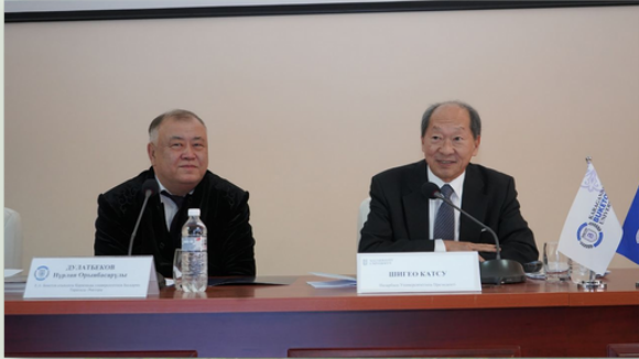
Бөкетов атындағы Қарағанды университеті SDSN Kazakhstan ұйымына ресми түрде қосылды.